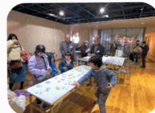
楽しいかるた取り風景

当日は多くの観客が会場に来られ、当展示ルームに見えたお客様の反応は「初めて名前を知った」「かなりレベルの高い活動されているのですね」とかの評価を頂きました。多摩プロバスかるたは絵柄、説明文章は当時の会員による自作作品です。手にされた方からは是非とも購入したいとの希望が寄せられ、増刷するかどうかの検討することになりました。