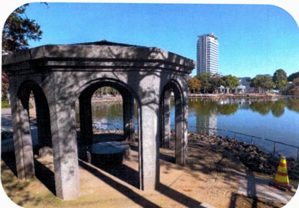
「春を待つ中央公園」: 大きなイベントや市民の憩いの場として親しまれています。大幅な改修工事がこの春完工の予定です。