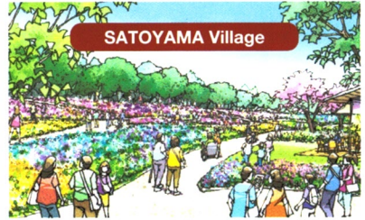
自然と人、人と人が関わりあい、共に生きる