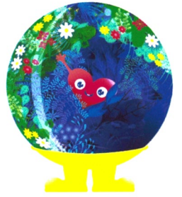
公式マスコット キャラクター

2027年に神奈川県横浜市（旧上瀬谷通信施設）で開催される国際園芸博覧会の略称です。「植物」、「花」、「緑」を総称し、「自然」、「環境にやさしい」という「GREEN」、国際的に共通する課題の解決に寄与する国際博覧会「EXPO」という語を掛け合わせ、これからの自然と人、社会の持続可能性を追求し、世界と共有する場であることを表現しました。日本では1990年の大阪花の万博以来37年ぶりとなる最上位（A1クラス）での開催で、BIE（博覧会国際事務局）認定の万博でもあります。