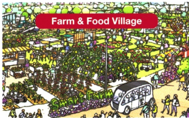
「農」と「食」を通じてウェルビーイングを追求する