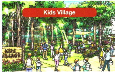
これからの地球を生きる子どもたちが自然と世界を学ぶ