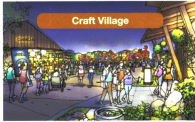
自然とのつながりの中で育まれた知恵・技術と出会う