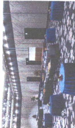
4F [伊勢] Ise