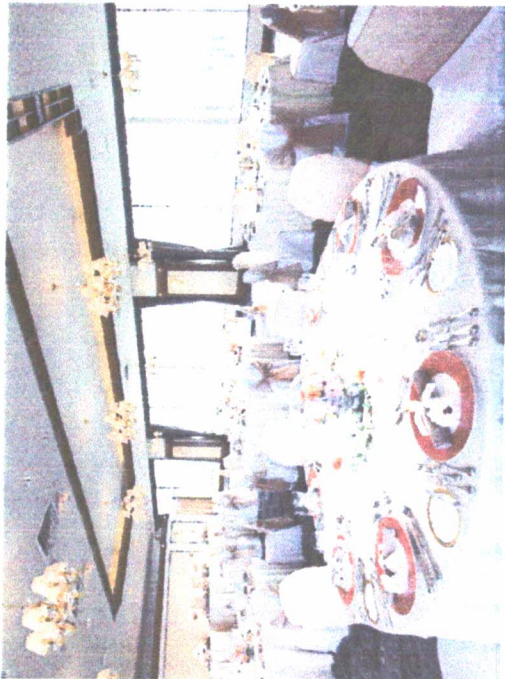
1F スカイシタケットラウンジ La Mer

鈴鹿山脈を望むスカイシタケットをはじめ、700名様収容の大宴会場、親しい方達との少人数のご宴会まで、目的に合わせてお選びいただけます。心に残る集いのひとときを、洗練されたサービスで華やかに演出いたします。