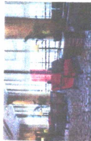
4F ロビー Lobby

From the Sky Banquet room with Mt. Suzuka views to the Grand ballroom which could accommodate up to 700 guests, we could take care of your function whether it is an intimate social small gathering or a lavish reception. Our professional staff will ensure a smoothly run memorable function.