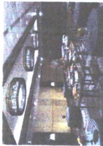
3F [鈴鹿] Suzuka

鈴鹿山脈を望むスカイシタケットをはじめ、700名様収容の大宴会場、親しい方達との少人数のご宴会まで、目的に合わせてお選びいただけます。心に残る集いのひとときを、洗練されたサービスで華やかに演出いたします。